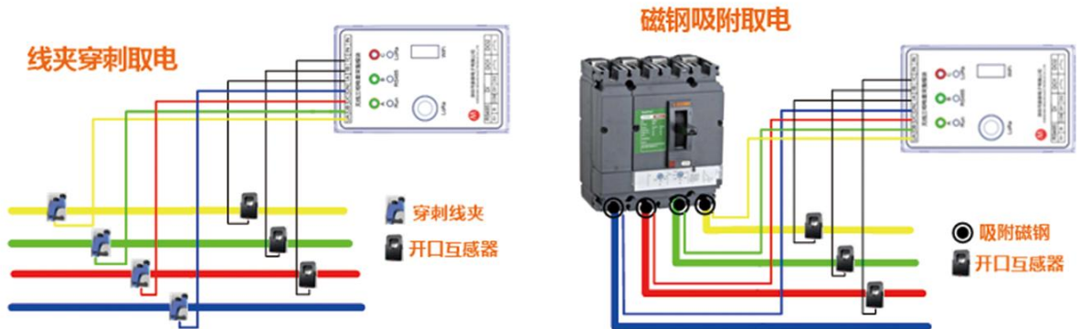
220V 低压三相四线系统应用